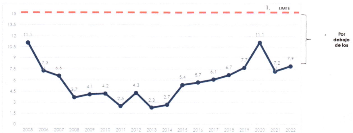
Gráfico N° 2 Indicador de Liquidez Servicio de Deuda/Exportaciones (en %)

MSD: Marco de Sostenibilidad de Deuda por el BM y el FMI.