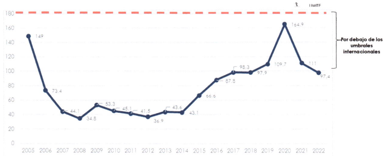
Gráfico N° 3 Saldo Deuda/Exportaciones (en %)

MSD: Marco de Sostenibilidad de Deuda por el BM y el FMI.