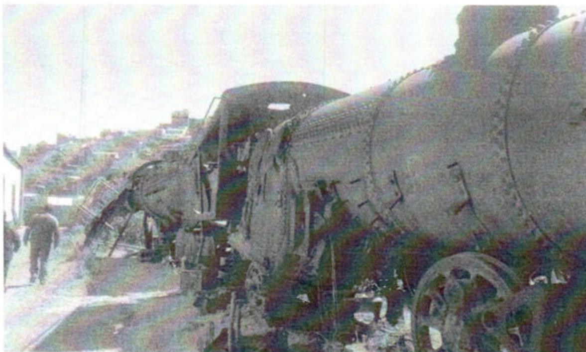
Locomotora a vapor Galpón 2

ASAMBLEA LEGISLATIVA PLURINACIONAL DE BOLIVIA CÁMARA DE DIPUTADOS