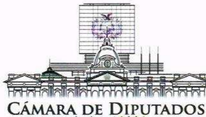
Dip. I. Renán Cabezas Verza PRESIDENTE COMISION DE CONSTITUCION LEGISLACION Y SISTEMA ELECTORAL CAMARA DE DIPUTADOS Asamblea Legislativa Plurinacional

generen se regularán por la Ley, para atender prioritariamente a su conservación, preservación y promoción.” II. “El Estado garantizará el registro, protección, restauración, recuperación, revitalización, enriquecimiento, promoción y difusión de su patrimonio cultural, de acuerdo con la ley”.