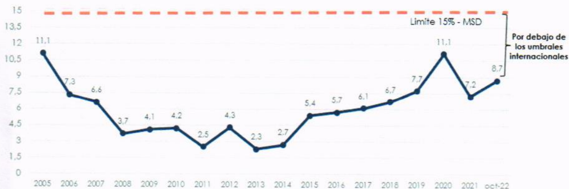
Gráfico N° 2 Indicador de Liquidez Servicio de Deuda / Exportaciones de Bienes y Servicios (en %)