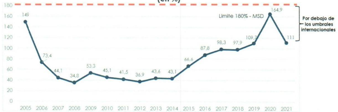
Gráfico N° 3 Saldo Deuda / Exportaciones de Bienes y Servicios (en %)